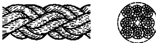
Рисунок 3 — Конфигурация 8-рядного плетеного каната (тип L)